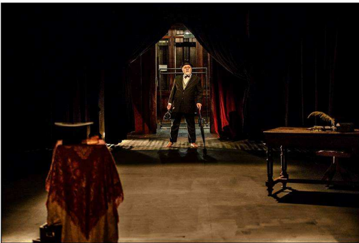
Castigo del Cielo || marzo 2016 [C] foto alejandro persichetti