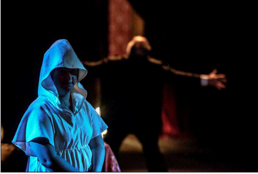
Castigo del Cielo || marzo 2016 [C] foto alejandro persichetti