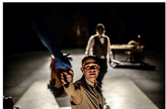
Castigo del Cielo || marzo 2016 [C] foto alejandro persichetti