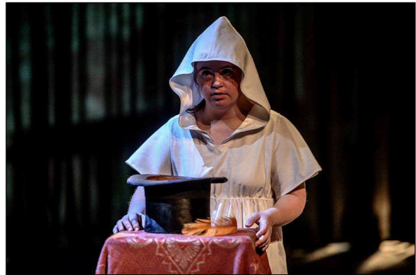
Castigo del Cielo || marzo 2016 [C] foto alejandro persichetti