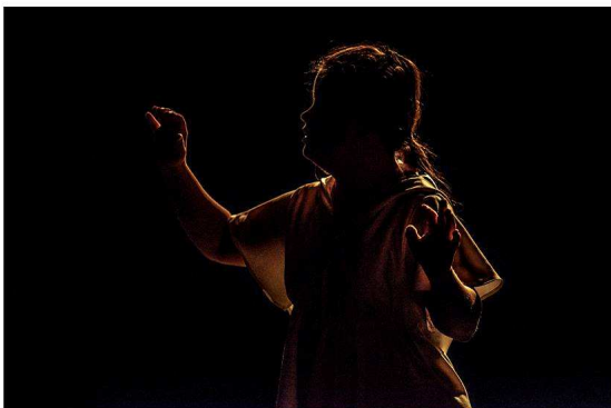
Castigo del Cielo || marzo 2016