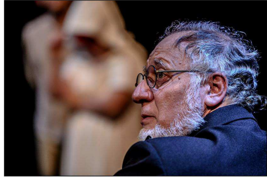
Castigo del Cielo || marzo 2016 [C] foto alejandro persichetti