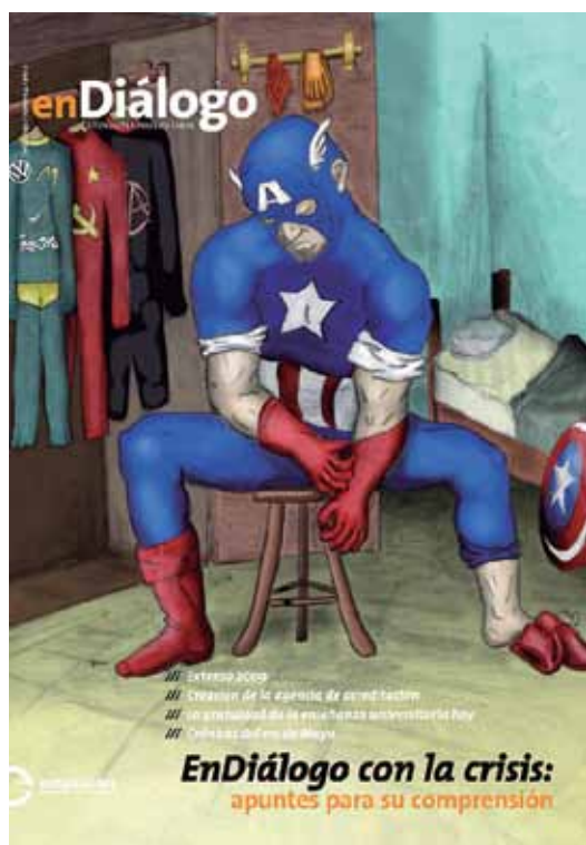
Número 4, Junio 2009.