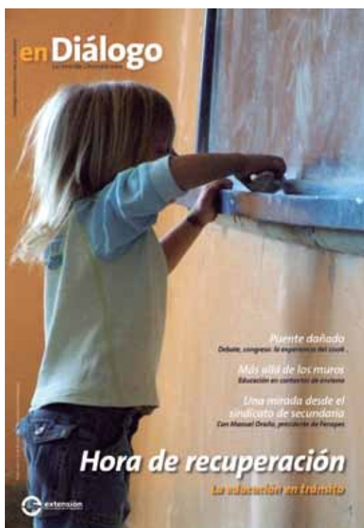
Número 11, Julio 2012.