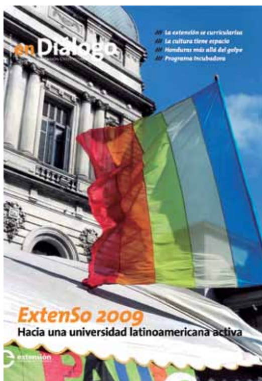
Número 5, Noviembre 2009.