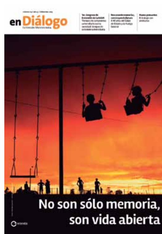
Número 14, Setiembre 2013.