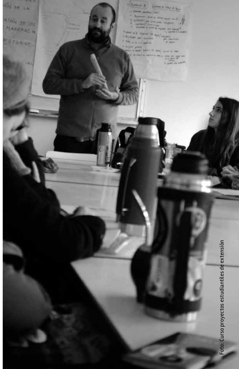
Foto: Curso proyectos estudiantiles de extensión

En la puesta en común los grupos compartieron el problema social que se desprendía del artículo trabajado, los sujetos y lugares de enunciación, los argumentos y ejes del texto. De esta manera, el lugar de los medios de comunicación, las relaciones hegemónicas del patriarcado, los estereotipos de hombre y mujer contruidos, la violencia simbólica, el sexismo y el racismo como ideologías y la negación de la modernidad de la idea de raza como categoría social explicativa, se discutieron y problematizaron a partir de situaciones concretas que las notas reflejaban, y nos interpelaban. Entre otras cosas, para entender las “dimensiones de raza y género como dimensiones po-