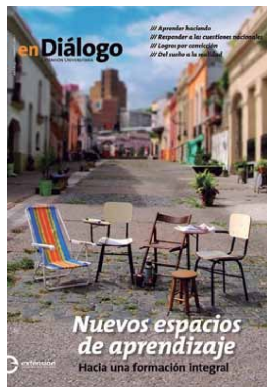
Número 6, Mayo 2010.