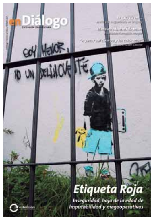
Número 9, Octubre 2011.