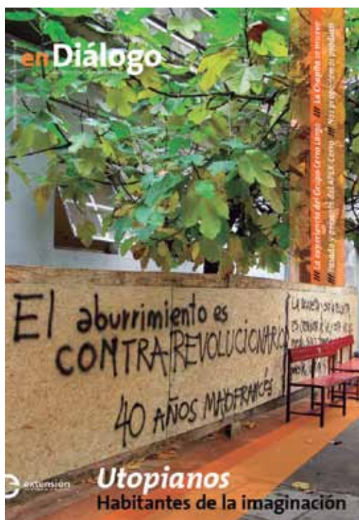
Número 1, Mayo 2008.

Como indica el título de esta nueva edición de la revista enDiálogo, buscamos en este número dar cuenta de los procesos desarrollados desde Extensión Universitaria en estos dos últimos períodos rectorales. Allí por 2008, fue cuando desde la Comisión Sectorial de Extensión y Actividades en el Medio, se impulsó el trabajo en torno a la comunicación y difusión de las acciones, debates y temas de interés para la extensión universitaria. Así surgió entre otras iniciativas la publicación de la revista enDiálogo. Para repasar esta historia es que compartimos este fotoreportaje recordando algunas de las portadas de nuestra revista, que reflejan parte del recorrido del Programa de Comunicación en estos años, pero también el de la extensión universitaria y la propia UdelAR.