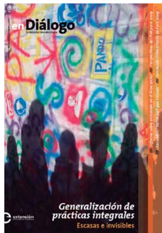
Número 3, Diciembre 2008.